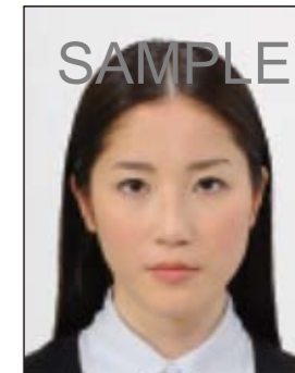
✕ ジャギーがあるもの

眼鏡やヘアバンド以外にも、帽子や衣服、布、マスク、イヤリング、カチューシャなど顔の器官が隠れるような大きめの装飾品等は好ましくありません。なお、顔の器官を隠さず髪を上げるため等の小ぶりの装飾品は受理しますが、着ける箇所によっては不適当となる場合があります。大きさ等の判断に迷う場合は装飾品をはずした写真をお持ちください。