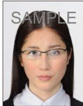
✕ 照明が眼鏡に反射したもの

撮影時にピントが合っていないかたり、手ブレしてしまったために画像が不鮮明なものや背景に人物の影があるものは不適当です。