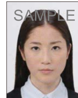
✕ ドットやインクのにじみなどがあるもの

デジタル印刷の場合、ドット（網状の点）やジャギー（階段状のギザギザ模様）、インクのにじみなどがみられるものは不適当です。写真専用紙等を使用し、鮮明な画質で印刷してください。