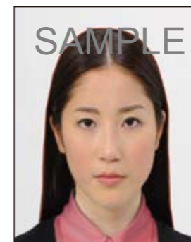
✕ 変形やマスクングなどの画像処理を施したものの

頭髪のボリュームが極端に大きな場合には、下図に示すように「両眼の中心から頭頂までの距離」は「両眼の中心から顎までの距離」と等しいものとみなして、トリミングしてください。