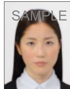
✕ ピンボケや手ブレにより不鮮明なもの

撮影時にピントが合っていないかたり、手ブレしてしまったために画像が不鮮明なものや背景に人物の影があるものは不適当です。