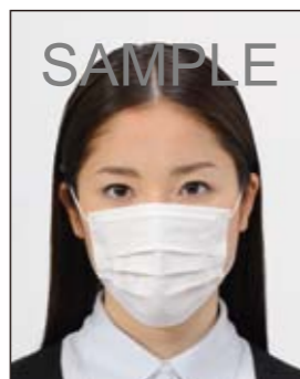
✕ 顔の器官が隠れる装飾品等があるもの