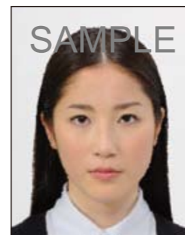
✕ ノイズがあるもの

画像ファイルの過剰な圧縮等が原因となってノイズ（画像の乱れ）が発生しているもの、変形やマスクング（縁取り）などの画像処理を施したものは不適当です。