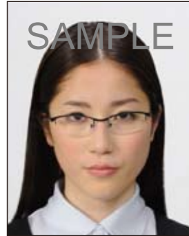
✕ 眼鏡のフレームが目にかかっているもの

今後、出入国審査等で旅券に内蔵されている IC チップに記録された顔画像とその旅券を提示した人物の顔を電子機器等で照合することが見込まれ、眼鏡のフレームや照明の反射が目にかかっているものやフレームが非常に太いものなどは、照合の妨げとなる可能性がありますので注意が必要です。