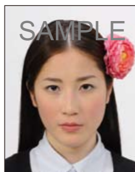
✕ 顔や頭の輪郭が隠れる装飾品等があるもの

画像ファイルの過剰な圧縮等が原因となってノイズ（画像の乱れ）が発生しているもの、変形やマスクング（縁取り）などの画像処理を施したものは不適当です。