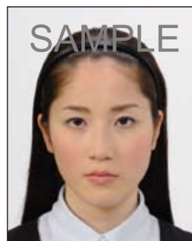
○ 顔の器官を隠さず、小ぶりなもの

眼鏡やヘアバンド以外にも、帽子や衣服、布、マスク、イヤリング、カチューシャなど顔の器官が隠れるような大きめの装飾品等は好ましくありません。なお、顔の器官を隠さず髪を上げるため等の小ぶりの装飾品は受理しますが、着ける箇所によっては不適当となる場合があります。大きさ等の判断に迷う場合は装飾品をはずした写真をお持ちください。