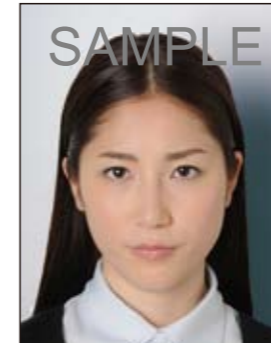
✕ 背景に影があるもの

デジタル印刷の場合、ドット（網状の点）やジャギー（階段状のギザギザ模様）、インクのにじみなどがみられるものは不適当です。写真専用紙等を使用し、鮮明な画質で印刷してください。