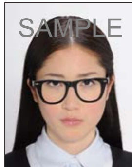
✕ フレームが非常に太く目や顔を覆う面積の大きいもの